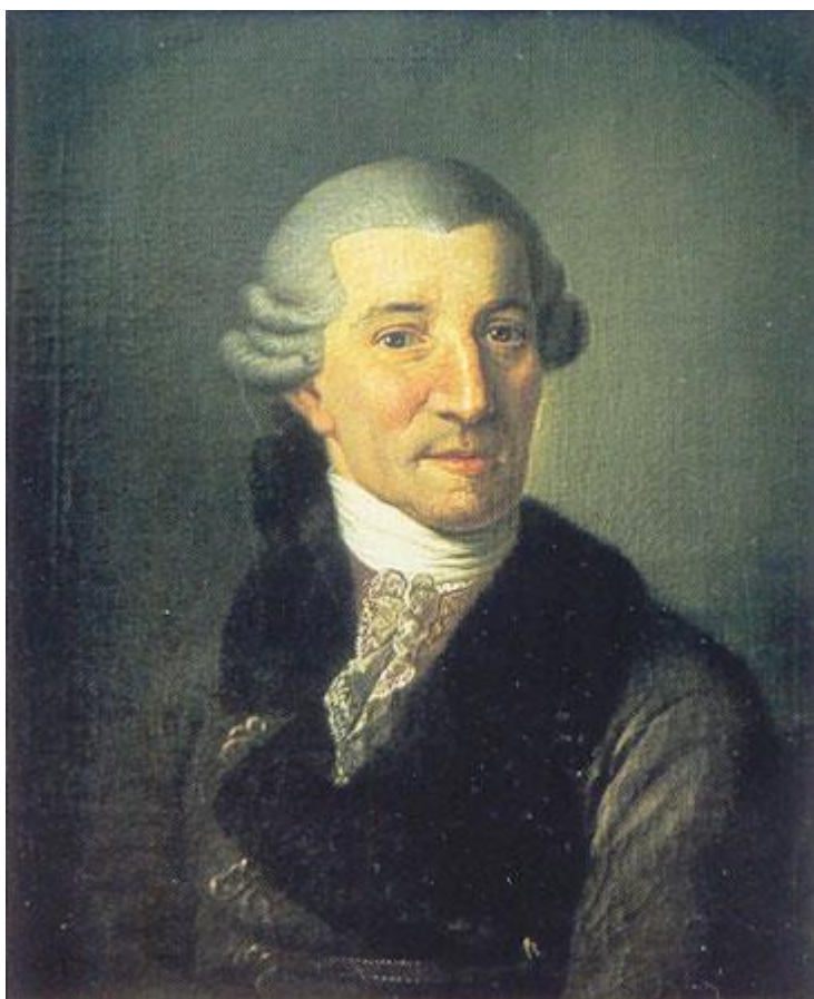
Joseph Haydn

Lite av den negativa inställning som Leopold hade mot Constanze, försvann vid hans besök i Wien. Han fann att hon var en bra husmor: "Vad mat och dryck beträffar, så är hushållet i högsta grad ekonomiskt skött." Leopold reste hem igen i slutet av april. Innan han for blev han frimurare i samma loge som Wolfgang. Även Haydn blev frimurare, men i en annan loge, Den sanna endräkten, på våren 1785. Då Mozart hade tillträde till alla loger i Wien, stärkte detta ytterligare banden mellan de båda musikerna.