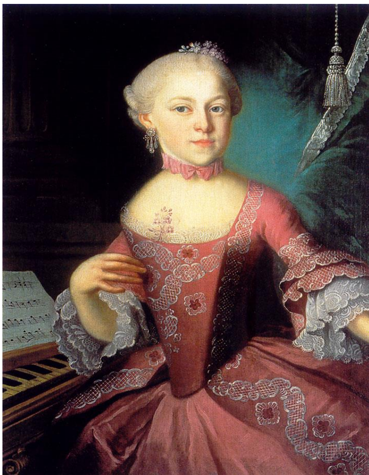
Nannerl 12 år (Pietro Antonio Lorenzoni)

Tidigt iakttog fadern att Nannerl hade starka musikaliska anlag. Han började undervisa henne i pianospel och gjorde i ordning ett övningshäfte åt henne. Faderns undervisning av Nannerl gjorde ett djupt intryck på Wolfgang. Han började att leka med pianot, letade ut klanger som tilltalade hans öra och lyssnade på dem. När fadern upptäckte att sonen hade detta intresse för musik, gav han honom en smula handledning, och redan i sexårsåldern komponerade Wolfgang små stycken. Något år tidigare hade fadern infört små anteckningar i Nannerls övningshäfte, men dessa rörde Wolfgang. En av de första notiserna står under noterna till ett litet scherzo av österrikaren Wagenseil: "Detta stycke lärde sig Wolfgang den 24 januari 1761, tre dagar innan han fyllde fem år, mellan klockan nio och halv tio på kvällen." Ganska snart fick Wolfgang en egen musikalisk övningsbok.