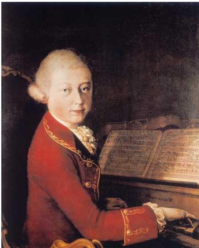
Wolfgang Amadé Mozart 14 år (Domenico Saverio dalla Rosa, 1770)

Från Rom fortsatte de till Neapel, som var den sydliga slutpunkten för deras resa. Staden var Europas viktigaste operacentrum. Wolfgang gav där en mycket lyckad konsert hos det kejsarliga sändebudet.