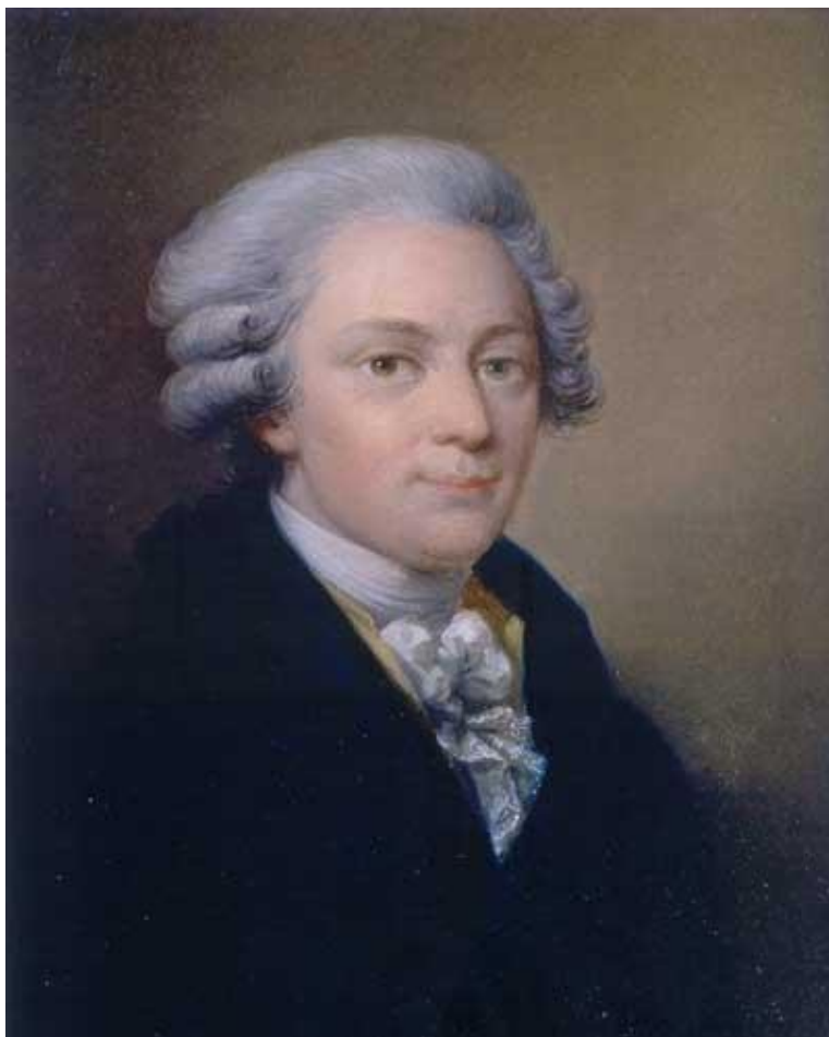
Wolfgang Amadé Mozart, c. 1790 (Joseph Grassi)

Ifrån premiären på Così fan tutte till slutet av september låg Mozarts skapande verksamhet nästan helt nere. Under denna tid tillkom endast två stråkkvartetter, beställda av den preussiske kungen, samt bearbetningar av ett par Händel-verk, beställda av Mozarts vän van Swieten.