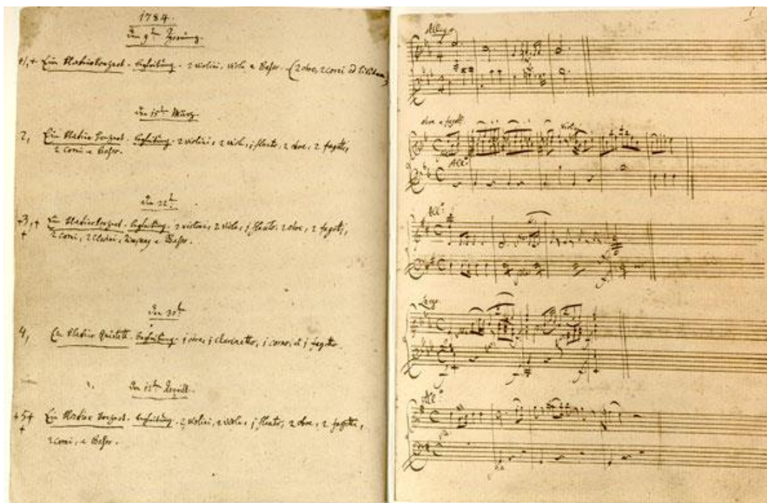
Första noteringarna i Mozarts verkkatalog

Han hade nu fullt upp att göra. En förteckning över sitt konserterande, som han skickade till fadern, berättar att han, från den 26 februari till den 3 april, inte hade mindre än 22 uppträdanden. I april när Wolfgang berättade om tillkomsten av en pianokvintett, talade han samtidigt om att han "blivit ordentligt trött av det ideliga spelandet" på pianot. Han hade stor framgång med sitt spelande. Men han konserterade inte bara; han gav även lektioner. "Hela förmiddagen går åt till lektioner, alltså återstår endast kvällen för mitt kära arbete: att komponera", skriver han.