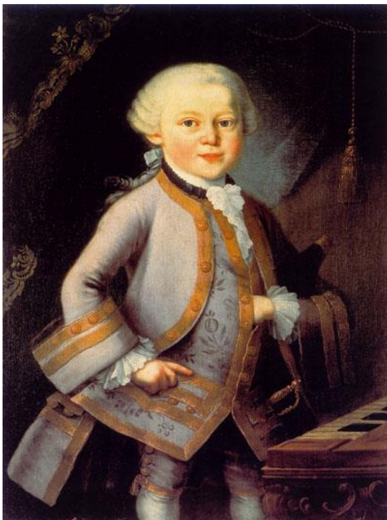
Wolfgang Amadé Mozart 6 år (Pietro Antonio Lorenzoni)

musik utan även i tidens alla skolämnen: i tyska, franska och italienska likaväl som i fysik, geografi, matematik, historia, moral och praktisk levnadskonst.