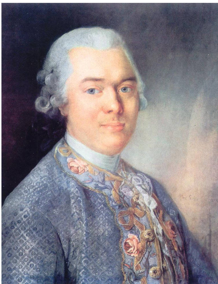
Gottfried van Swieten