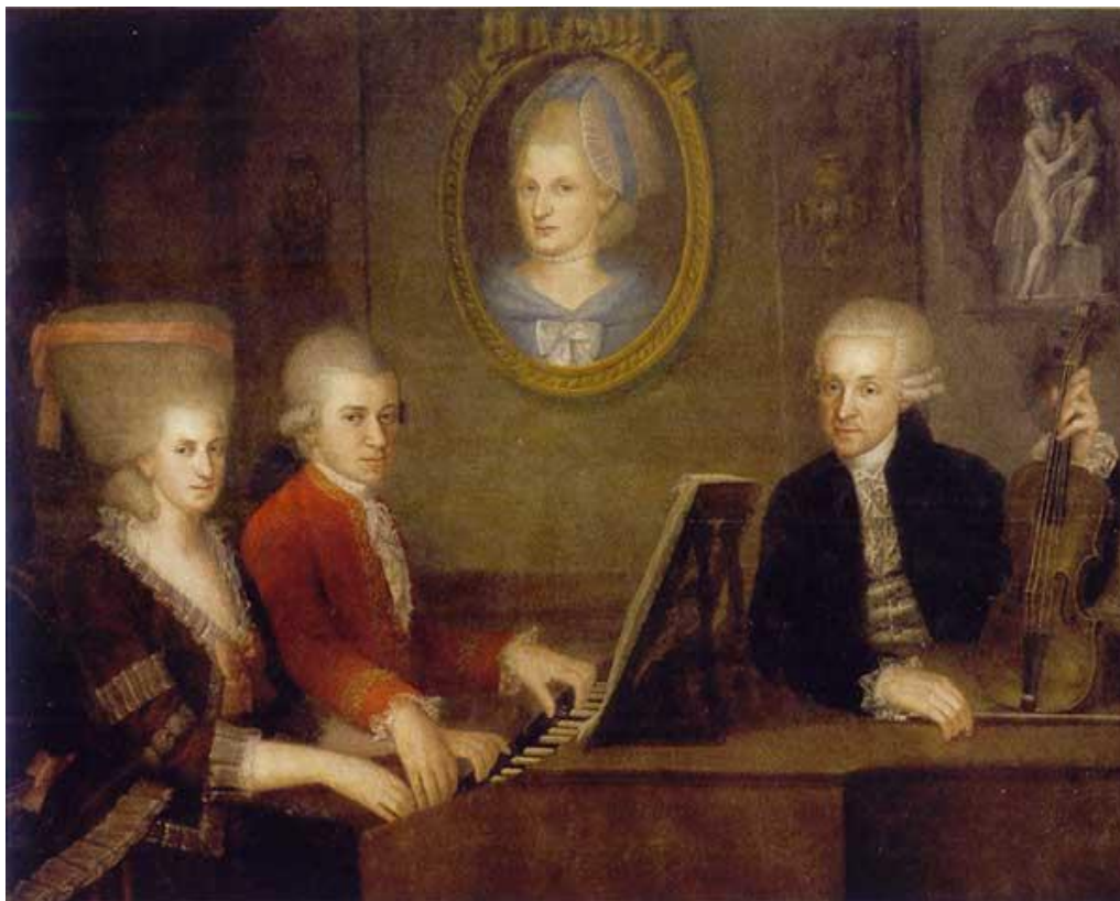
Nannerl, Wolfgang Amadé och Leopold Mozart (Johann Nepomuk della Croce, c 1780-81)