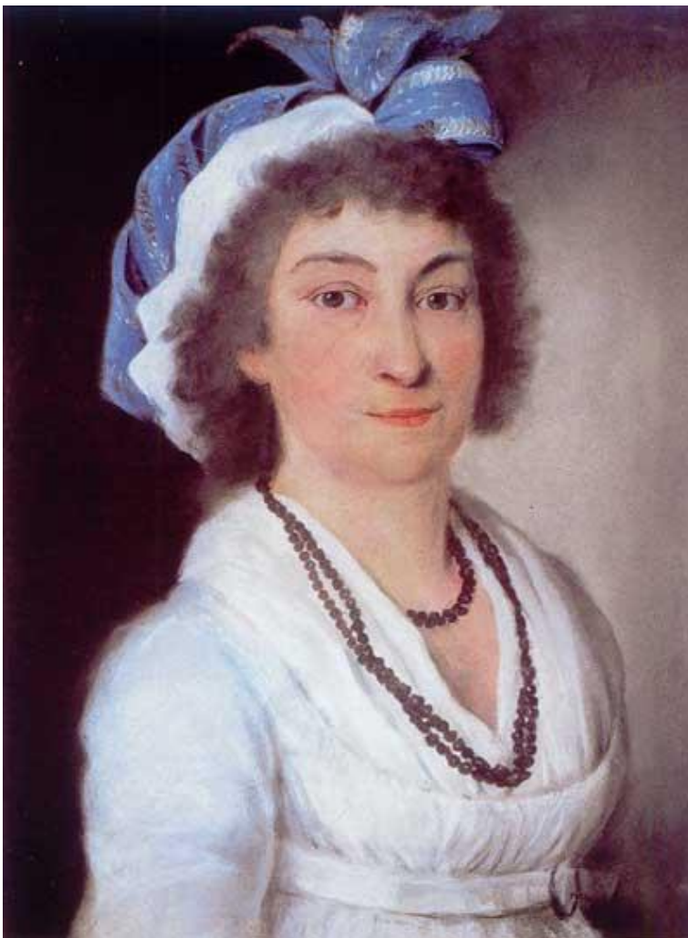
Constanze Weber (1790)