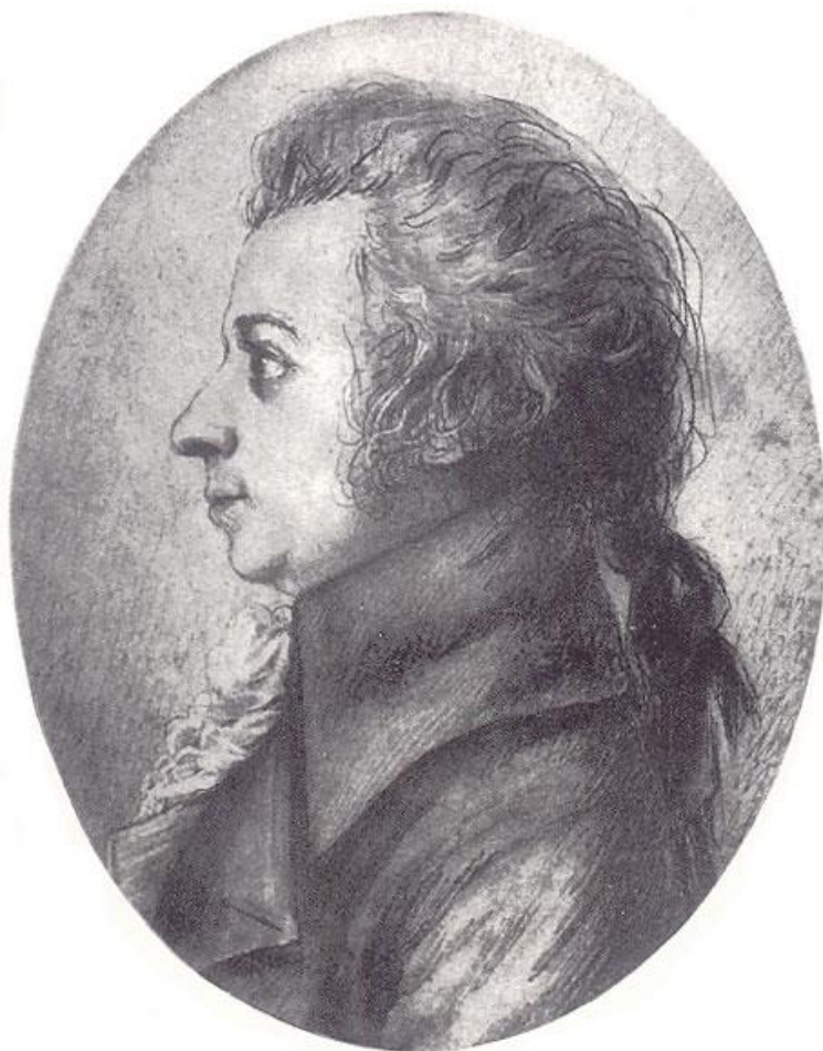
Wolfgang Amadé Mozart (Dorothea (Doris) Stock, 1789)

Dresden spelade han sin senaste pianokonsert för kurfursten. För det fick han en ”riktigt vacker snusdosa” med inneliggande 100 dukater. Den 20 april anlände han till Leipzig. Där fick han spela på orgeln i Johann Sebastian Bachs kyrka, S:t Thomas. I Leipzig gav han en konsert som var ”glänsande nog vad bifall och ära beträffar, men tyvärr desto magrare i fråga om intäkter”, som Mozart skrev hem till Constanze. Under sin resa fick Mozart en beställning från den preussiske kungen Friedrich Wilhelm II på sex stråkkvartetter för sig själv och sex lätta pianosonater för prinsessan Friederike Charlotte. Han kom bara att skriva tre av de preussiska kvartetterna , den första 1789 och de två sista 1790. Av sonatorna komponerades endast en, 1789.