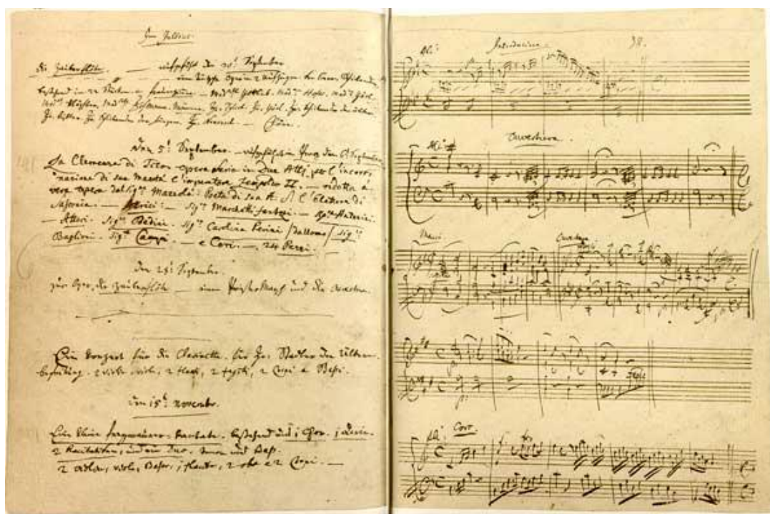
Ur Mozarts verkkatalog

Mozarts kompositioner anges inte med opustal som hos många andra tonsättare, utan med nummer enligt Ludwig Köchels förteckning från 1862. Denna förteckning innehåller en del fel, speciellt beträffande barndomsverken, och den har därför reviderats, bland annat av Alfred Einstein; men vanligast är att den, enligt Köchel, ursprungliga numreringen används. Mozarts kompositioner brukar anges på följande sätt: Sinfonia concertante i Ess-dur för violin och viola och orkester (KV 364) eller (K 364). KV står för Köchel-Verzeichnis.