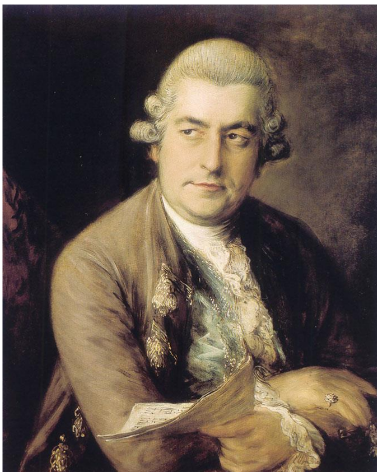
Johann Christian Bach (Thomas Gainsborough, 1776)

I mitten av april bröt familjen upp från Paris med London som mål. De kom fram dit i slutet av månaden. Redan några dagar efter ankomsten kallades familjen Mozart av Georg III och hans gemål Charlotte, vilka var mycket musikintresserade, till ett framträdande i S:t James' Palace. Leopold var besviken på honoraret, 24 guineas, men han ansåg för övrigt att mottagandet var det mest förnämliga de fått någonstans. Det blev sedan ytterligare två konserter inför hovet.