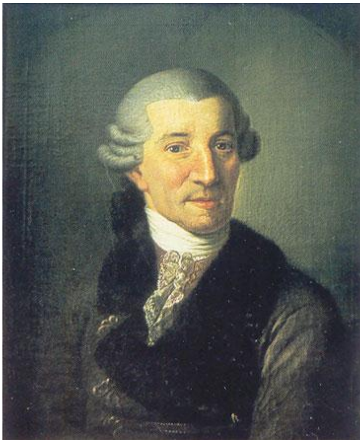
Joseph Haydn (Christian Ludwig Seehas, 1783)