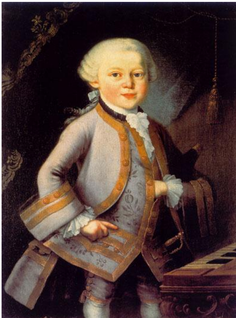
Wolfgang Amadé Mozart 6 år (Pietro Antonio Lorenzoni)

I början av 1762 reste Leopold till München med sina två musikaliska underbarn. München var närmaste större musikcentrum och styrdes av en musikälskande kurfurste. Där gav fadern och barnen en konsert för kurfursten och skördade väldigt bifall.