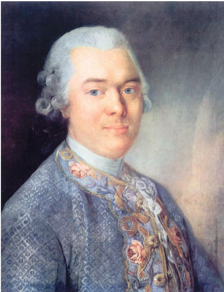
Gottfried van Swieten

I slutet av 1782 skrev Mozart sin första stråkkvartett (K 387) på 10 år. Det var den första av de sex berömda kvartetterna, skrivna under loppet av ungefär två år, som Mozart tillägnade Haydn. Denne hade i slutet av 1781 utgivit sex stråkkvartetter som enligt honom var skrivna ”på ett alldeles nytt och särskilt sätt”. Med dessa kvartetter fick Mozart upp ögonen för denna kompositionsforms möjligheter.