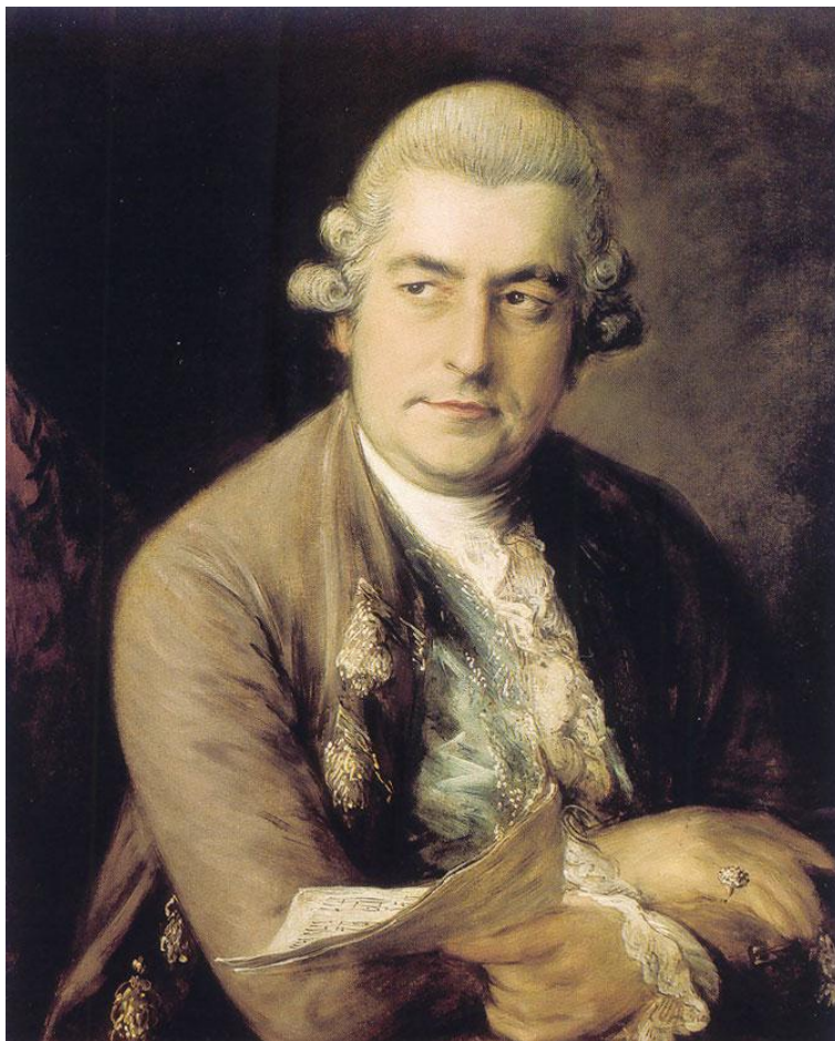
Johann Christian Bach (Thomas Gainsborough, 1776)

I mitten av april bröt familjen upp från Paris med London som mål. De kom fram dit i slutet av månaden. Redan några dagar efter ankomsten kallades familjen Mozart av Georg III och hans gemål Charlotte, vilka var mycket musikintresserade, till ett framträdande i S:t James' Palace. Leopold var besviken på honoraret, 24 guineas, men han ansåg för övrigt att mottagandet var det mest förnämliga de fått någonstans. Det blev sedan ytterligare två konserter inför hovet.