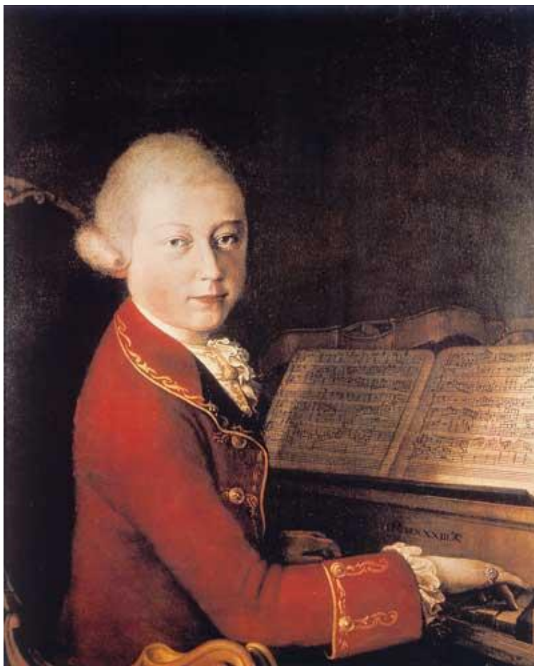
Wolfgang Amadé Mozart 14 år (Domenico Saverio dalla Rosa, 1770)

framfördes varje år vid påsktiden Gregorio Allegris berömda Miserere. Verket bestod av nio körstämmor och noterna fanns endast i Sixtinska kapellet. De fick inte, enligt påvlig bestämmelse, föras ut ur kyrkan och de fick inte skrivas av. När nu Wolfgang var i Sixtinska kapellet hörde han det nämnda stycket och när han sedan kom hem skrev han ner hela kompositionen ur minnet. Nästa dag gick han och hörde stycket ännu en gång och rättade sedan ett par fel.