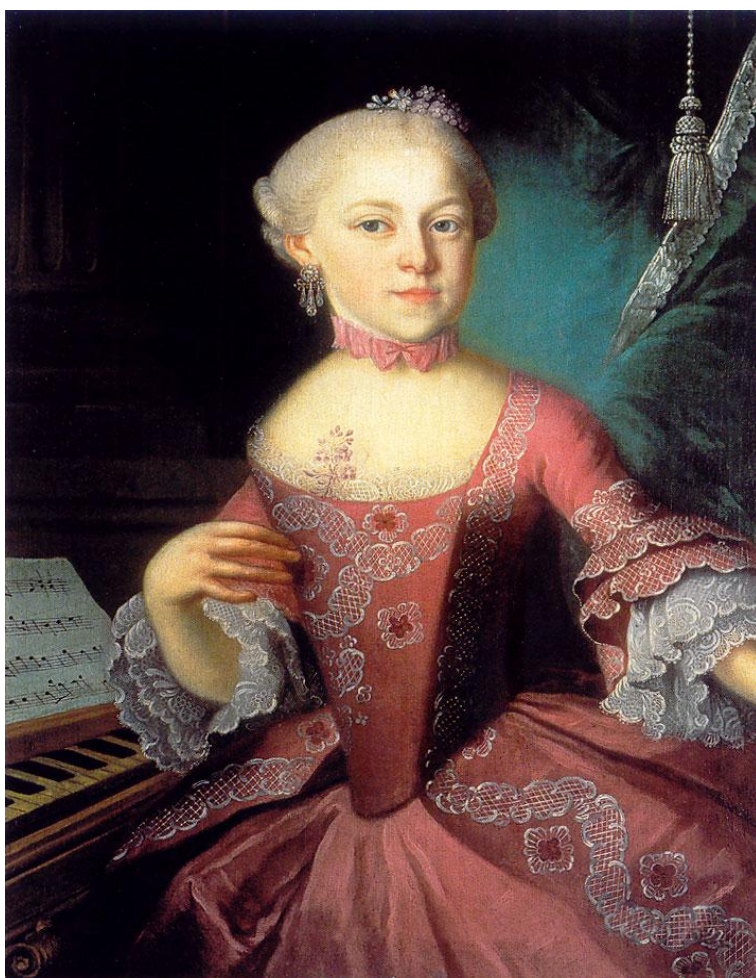
Nannerl 12 år

Tidigt iakttog fadern att Nannerl hade starka musikaliska anlag. Han började undervisa henne i pianospel och gjorde i ordning ett övningshäfte åt henne. Faderns undervisning av Nannerl gjorde ett djupt intryck på Wolfgang. Han började att leka med pianot, letade ut klanger som tilltalade hans öra och lyssnade på dem. När fadern upptäckte att sonen hade detta intresse för musik, gav han honom en smula handledning, och redan i sexårsåldern komponerade Wolfgang små stycken. Något år tidigare hade fadern infört små anteckningar i Nannerls övningshäfte, men dessa rörde Wolfgang. En av de första notiserna står under noterna till ett litet scherzo av österrikaren Wagenseil: ”Detta stycke lärde sig Wolfgang den 24 januari 1761, tre dagar innan han fyllde fem år, mellan klockan nio och halv tio på kvällen.” Ganska snart fick Wolfgang en egen musikalisk övningsbok.