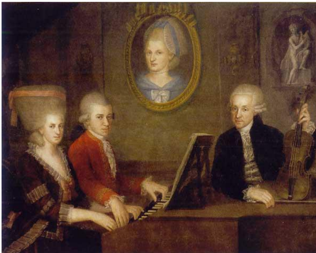
Nannerl, Wolfgang Amadé och Leopold Mozart (Johann Nepomuk della Croce, c 1780-81)