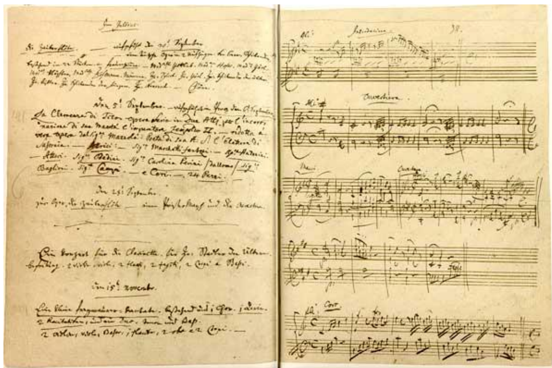
Ur Mozarts verkkatalog

Mozarts kompositioner anges inte med opustal som hos många andra tonsättare, utan med nummer enligt Ludwig Köchels förteckning från 1862. Denna förteckning innehåller en del fel, speciellt beträffande barndomsverken, och den har därför reviderats, bland annat av Alfred Einstein; men vanligast är att den, enligt Köchel, ursprungliga numreringen används. Mozarts kompositioner brukar anges på följande sätt: Sinfonia concertante i Ess-dur för violin och viola och orkester (KV 364) eller (K 364). KV står för Köchel-Verzeichnis.