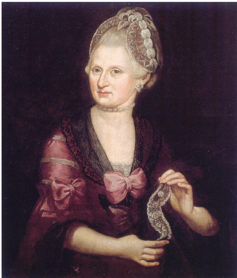
Anna Maria Pertl (Pietro Antonio Lorenzoni, 1775)

Leopold skrev till sonen att han snarast efter ankomsten till Mannheim skulle begära företräde hos kurfursten. Cannabich och en annan vän, den sextiosex-årige hovkapellmästaren Ignaz Holzbauer, ordnade så att Wolfgang fick spela både en pianokonsert och en sonat vid kurfurstens ståtliga namnsdagsfirande. Han fick då träffa det kurfursteliga paret. Furstinnan sa till Wolfgang: ”Jag försäkrar er, man kan inte spela bättre än ni gör.” För sitt framträdande fick Wolfgang inga pengar utan det gage han fick bestod i en vacker guldklocka. Wolfgang skrev: ”Nu har jag faktiskt fem klockor. Jag är starkt betänkt på att låta sy till ytterligare en klockficka på alla mina byxor; när jag så infinner mig hos någon potentat, bär jag två klockor på mig, så att ingen mer skall komma på tanken att förära mig ännu en.”